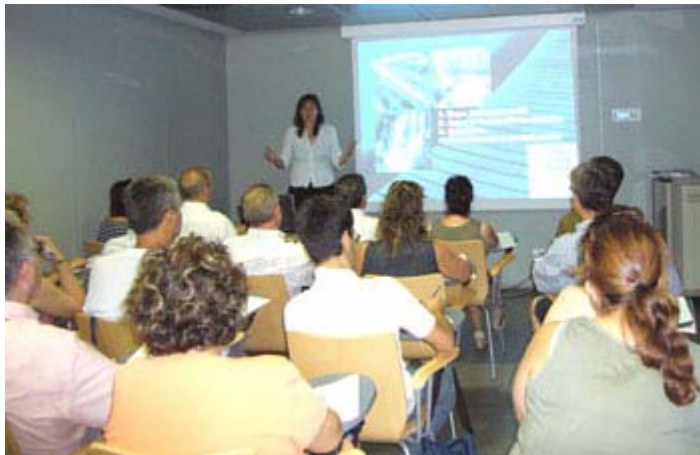
Expo2008: "Profesional del Departamento impartiendo clase". Octubre 2006

La Sociedad Expoagua ha firmado un convenio de colaboración con el Gobierno de Aragón con el fin de que las personas que lo deseen, puedan recibir la Formación General on line a través de la plataforma electrónica Aula Aragón. Todas aquellas personas que dispongan de dirección electrónica y que deseen formarse a través de la red, recibirán vía correo una clave para acceder a la formación on line.