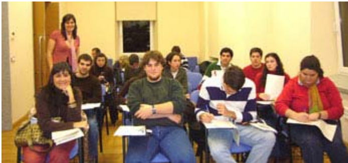
Expo2008: "Charla: Cabalgata de Reyes en Sevilla". Enero 2007