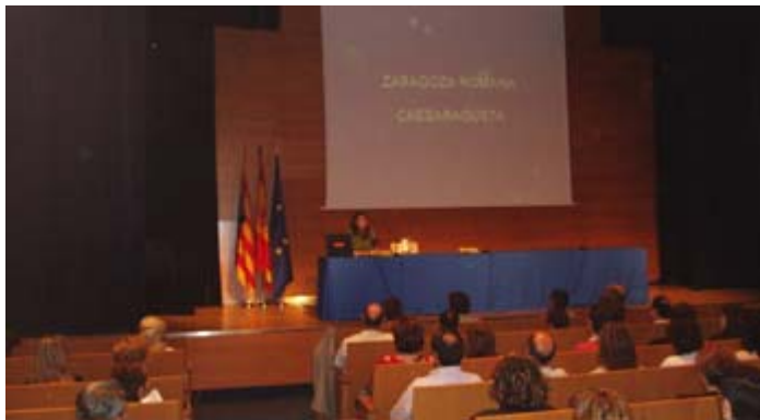
Expo2008: 1ª sesión de Formación específica de Turismo "Descubre Zaragoza". Abril 2007

Los idiomas constituyen uno de los puntos más importantes de esta formación específica. No se trata de clases presenciales al uso, sino que son tertulias en los idiomas que serán preferentemente hablados durante la Exposición y en las que se debaten los temas más relacionados con la misma (recinto, contenidos, importancia del agua y desarrollo sostenible...). Se trata de una formación eminentemente práctica que persigue que las personas voluntarias sean capaces de mantener una conversación fluida en los idiomas elegidos.